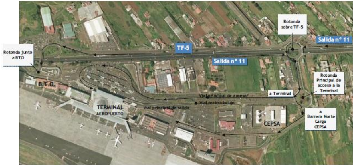
Fuente: Plan de Autoprotección del Aeropuerto Tenerife Norte.