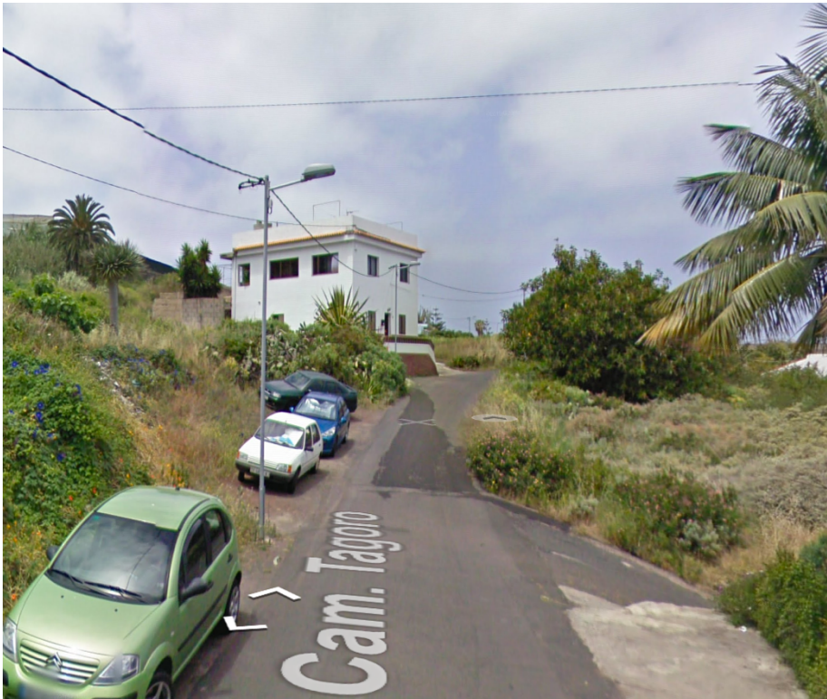
Estado actual de la trama urbano del Camino Tagoro.

1_ Entendemos que dicho tramo del camino no se encuentra contemplado por el actual PGO como urbano; sin embargo, este mismo tramo se encuentra en la actualidad consolidado y por el transcurrir, al igual que por la trama urbana, los servicios de abastos de los suministros, tal y como se observan en las fotografías adjuntas.