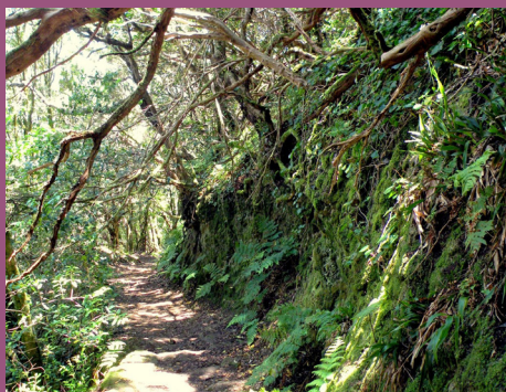
Caminando entre la laurisilva