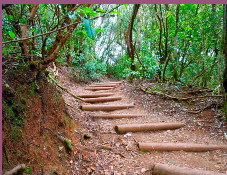
Tramo con escalera de troncos