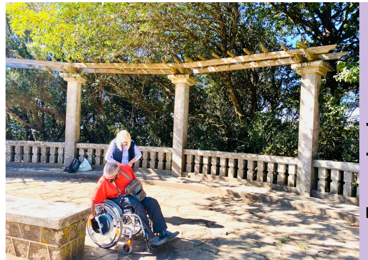
Zona de descanso