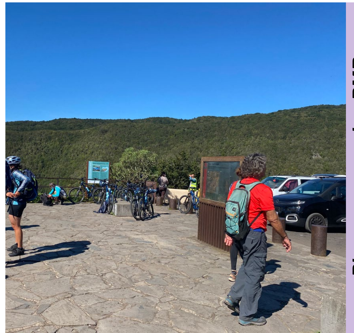
Plazas reservadas PMR