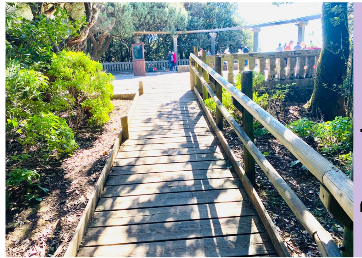
Rampa de acceso