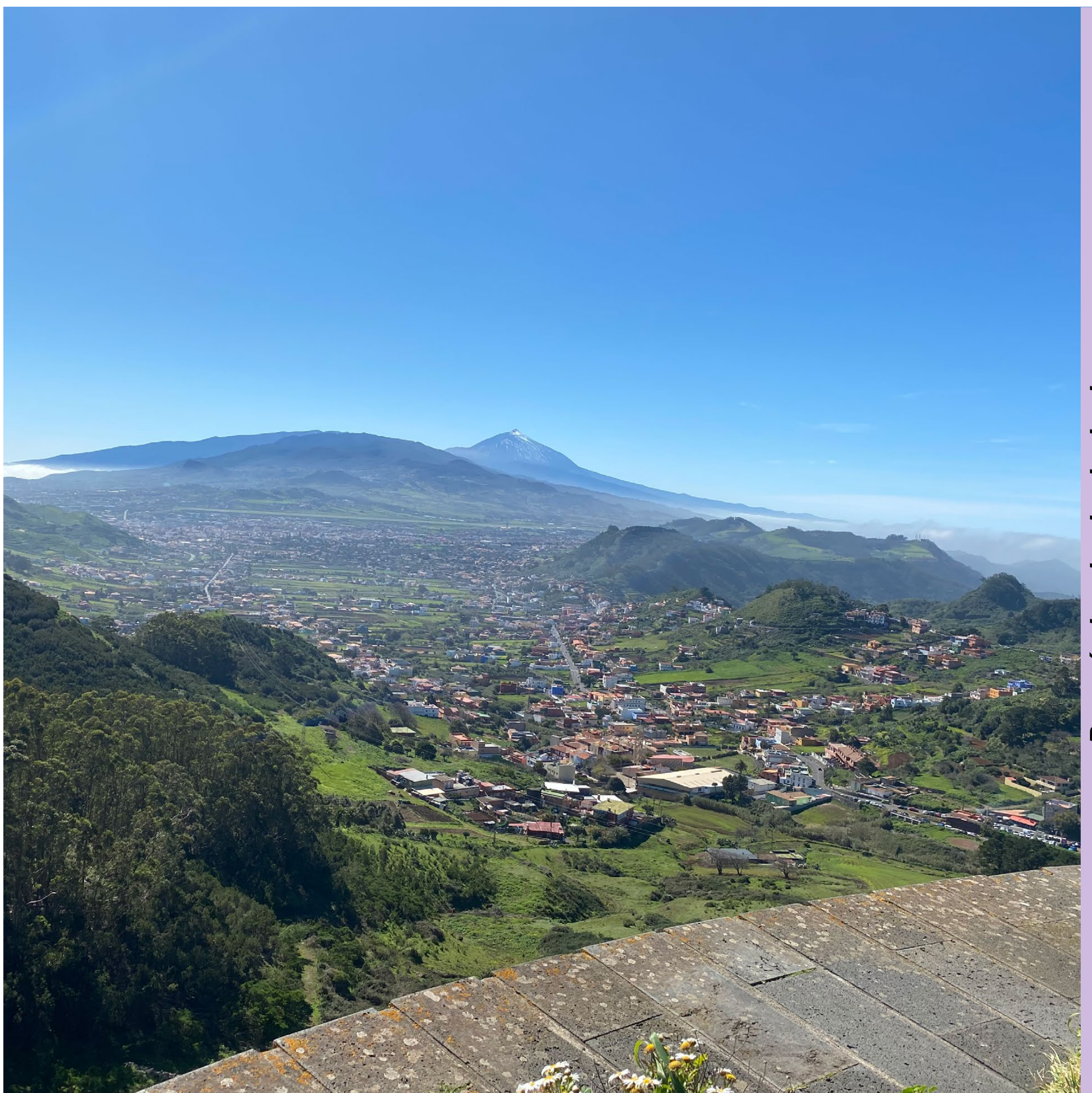
Panorámica desde el mirador