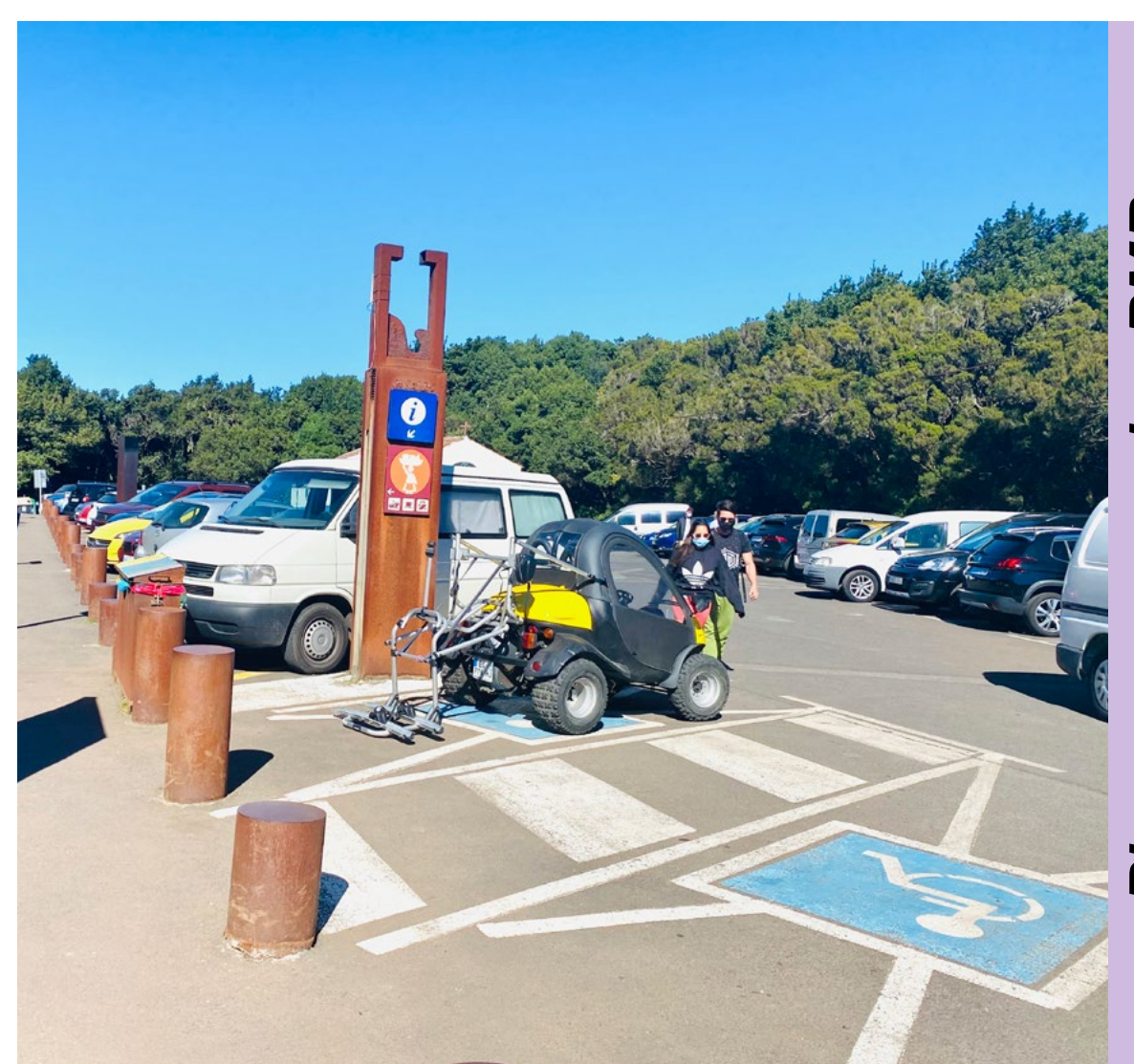
Plazas reservadas PMR